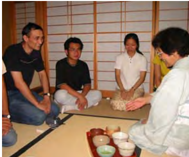
外国人留学生にとって素敵な体験になりました