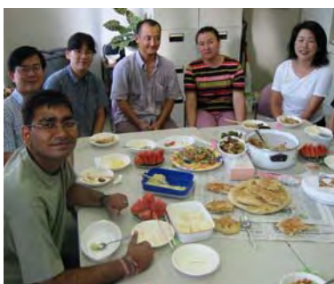
ブドウの葉でくるんだ肉を入れて炊いた 「ウズベク・ピラフ」 楽しい会話の花が咲きました。