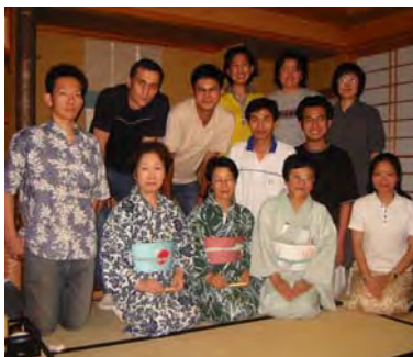
篠田さんのおもてなしの心に感動！ 本当にありがとうございました