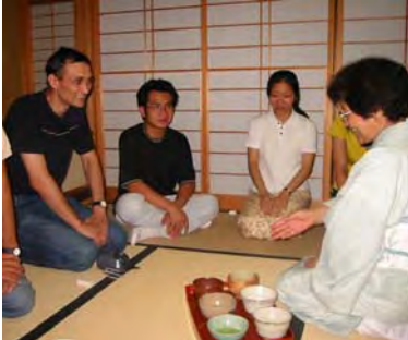
外国人留学生にとって素敵な体験になりました