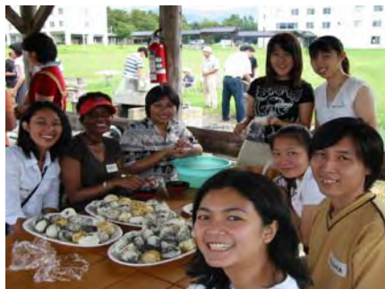
ラップやお椀を使い、味のある“onigiri”が出来上がりました

国際大学バーベキューサイトで、新入生歓迎BBQパーティーを行いました。心配だった天気も気持ちいいほど晴れて、むしろ暑すぎるくらいでした。参加者は予想をはるかに越える103人の大盛況。炭の準備が整うまでの間に、学生を交えておにぎり作りがスタート。そんなおにぎり達は20分足らずで胃袋に収まり、お肉は買い足すほどでした。