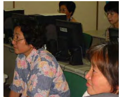
「息子に頼まなくてもメールが送れる!」「今日習ったこと忘れないうちにメールちょうだいね。」