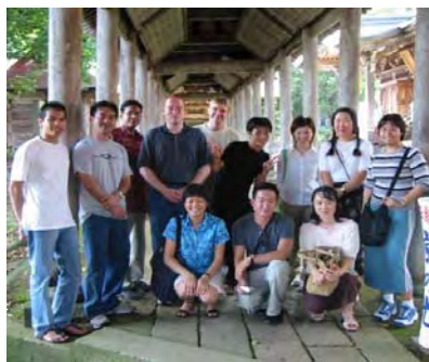
毘沙門堂で初めてののお寺体験