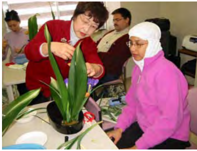
真剣なまなざし：華道教室