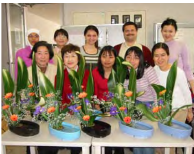
きれいにできましたね：華道教室