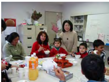
ぜんざい、おいしそう：キッズサロン