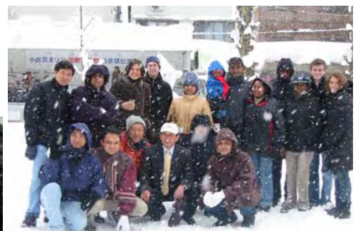
大雪でも楽しそう！小出町長と