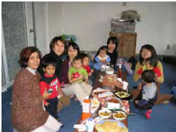
元気いっぱいの赤ちゃんサロンのメンバー 母国に帰っても一緒に遊んだこと覚えていてくれるかなあ