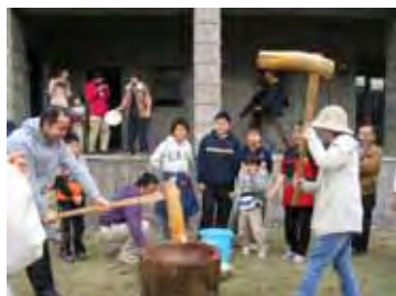
ラムズさんとチェンハンさん、なかなか息があっています