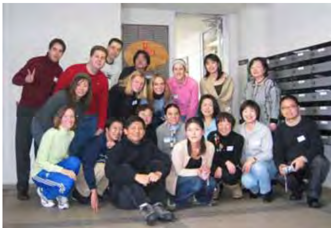
歓迎会終了後、みんなで記念写真

1月10日に、新しくIUJに留学して来た交換留学生の方たちを招いて歓迎会が催されました。軽食と飲み物の立食パーティの他に、略式ながら茶道の体験コーナーも設けられ、学生さんたちは日本の侘び寂びを体験する良い機会だったのではないかと思います。留学生とメンバーの、たくさん参加者にサロンは満杯でした。交換留学生さんたちの好奇心旺盛な様子に、異文化交流で得られる新鮮な驚きと楽しさに、改めて気づかされた思いです。留学生の皆さんには、限られた短い時間をめいっぱい楽しんで行ってほしいものですね。そのためにUMEXがお役に立てたら、とてもうれしいと感じます。(渡辺正志)