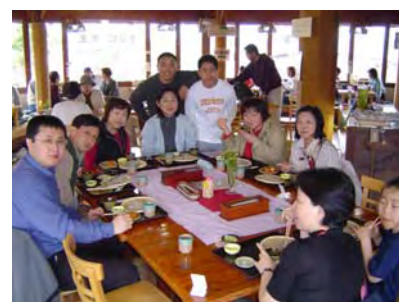
大王わさび農場内で昼食

お昼は大王わさび農場で、わさびそば、わさびコロッケ、わさびソフトクリームを美味しくいただきました。