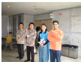
コンサート支えてくれた学生たち