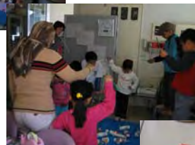
鯉のぼり うまくできたかな？