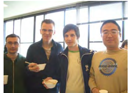
料理はおいしかったですか？

今回、ガーデンパーティーで始めてUMEXのイベントに参加させていただきました。予定ではグラウンドのバーベキューサイトとのことでしたが、あいにくの雨。屋内に会場を変更になったのですが、調理は中では出来ないとのことでエントランスですること。山菜は前日に取りに行ったそうですが、今年は雪解けも遅く地震の影響もあり沢山の山菜があったとのこと。日本の野草料理を外国の方に紹介するという企画なので、地元の私も始めて食べる山菜がありました。人もたくさん集まり、蕎麦を茹でる鍋もフル回転。てんぷらも揚げて、揚げて、なくなり。皆さん手際よくどんどん作っていました。さすが手馴れているにゃる。私もお手伝いさせていただいたのですが、普段料理とかなしないのがバレバレでした(汗) ご迷惑おかけしました…。始めは一人での参加だったので不安でしたが、茹でたてのお蕎麦に熱々のてんぷらを囲み、色々な国の学生の方、異業種、いろんな世代の会員さんとお話をし、楽しい時間を過ごす事が出来ました。