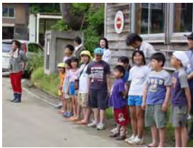
東下組小学校の皆さん