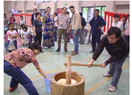
餅つきは大変ですか？

“日本の文化を外国人学生に伝えたい” “日本を選び、日本で学ぶ世界各国からの学生に日本人として日本の文化を紹介したい” という日本人学生の日頃の熱い思いがかたちとなり、5月21日（土）ジャパニーズナイトの開催となりました。“本物を体験する”をテーマに企画した本イベントのメインは夢っくすとの共同企画の“餅つき”で、日本一の米どころ魚沼産のもち米をその場で蒸かし、外国人学生と共に杵と臼でつき、つきあがった後は 手造りの魚沼風雑煮、あんこ等で、つきだての餅に舌鼓をうつ。この“餅つき”企画は大好評、大盛況となりました。臼の周りにはまさに“お祭り”で汗と笑顔があふれました。また、日本人学生の達人（有段者）が、剣