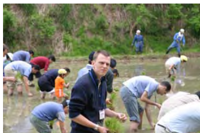
楽しかった？ディテルさん (感想寄せてくれた学生さん：中央)

6月5日に、外国の人たちと、がん入で田うえをしました。はじめに、田うえをして話せなかったけど、楽しくできてよかったです。つぎに、ぼくのうちで、きがえたりして、足もあらいました。そして、ごはんをたべて、話したりしました。「どこの人ですか。」ときいたら「スリランカです。」とこたえてくれました。さいごに、分校で、きねんしゃしんをとりました。田うえで、話せなかったけどノルウエーの人たちが話していたから、にぎやかになりました。はずしかったので、あまり話せなかったです。