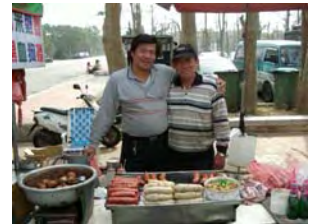
人懐っこい台湾人の おちゃん達 屋台で台湾名物 「笑顔」に捕まる

と親切な心意気。日本統治時代を経験した老人も、マスメディアを通しての認識でしかない若者、みんな「日本人」である私にこれでもかというほど優しくした。バスを待つ中学生たちも外国に対して興味津津で、私とのやりとりを楽しんでいるようだった。こんなにも若いうちから彼らのホスピタリティは培われているのか・・・と新しい発見に満たされていた。2年前と同じ気持ちでその地を離れることができ、本当に満足。「好意と誠意」大切にしていきたいです。