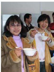
美味しそうですね！

の餅が付き上がる。早速、キナコ餅、雑煮、あんこ餅、大根おろして食べる。やはり、付きたての餅はコシがあり格別の味がする。食べ終わる頃には、2回目のもち米も吹き上がり、再度餅を付く。杵を持つ二人の呼吸も合い、1回目より上手にできた。満腹と思っていたのに、また、食べてしまう。最後に、留学生達と羽根突きをして、終了となった。