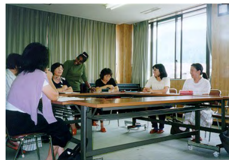
お互い刺激しあいながら楽しく学んでいます。