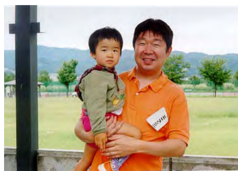
子供と一緒に夢っくすに参加しています。