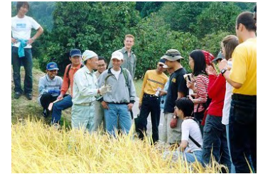
大成功の稲刈り体験ツアー