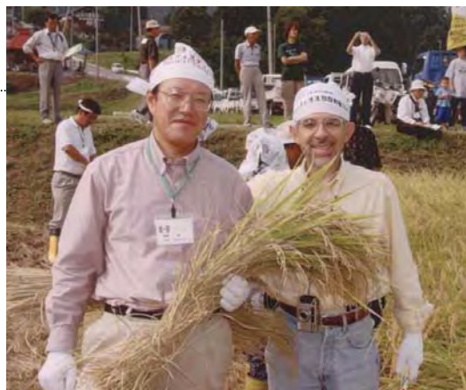
9月の稲刈り体験ツアーにて。左が私です。