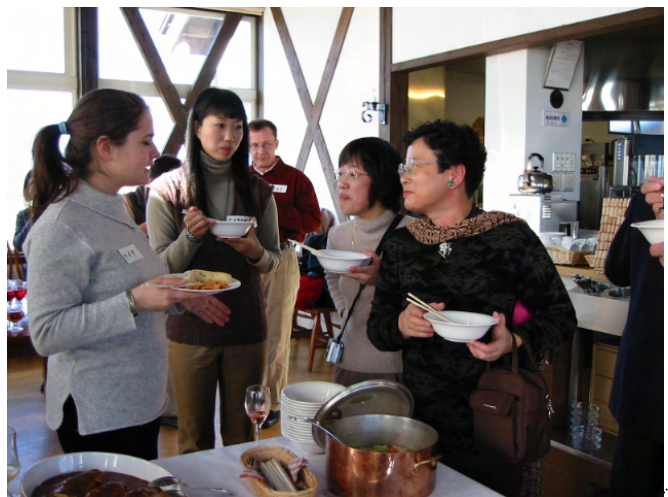
英会話教室の成果をユネスコプログラム歓迎会で発揮しました。