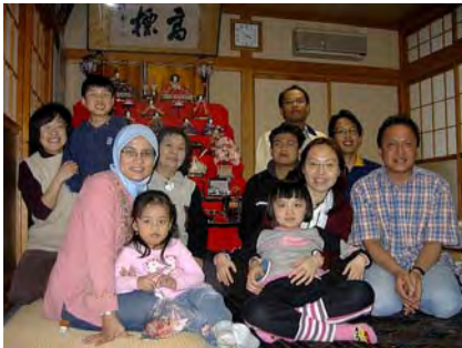
ご自宅でのひな祭りにて

副会長としての私は失格だったのかも……。でも、出来るときに出来ることをしながら、自分自身が楽しんで交流を続け、その結果少しは会のためにもお役に立てたのかな？そんな思いでふり返っています。