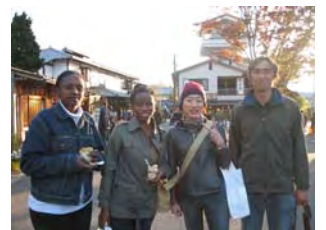
感想を寄せて頂いた方 (右から2番目：匿名希望?)

留学生の皆さんの感性に引き摺られたのか、馴染みのある歴史物や日本の風土を目新しく感じたような気がしたようなしないような。総じて言えば、新鮮で楽しかったということ。そして、また参加してみたいと思います。