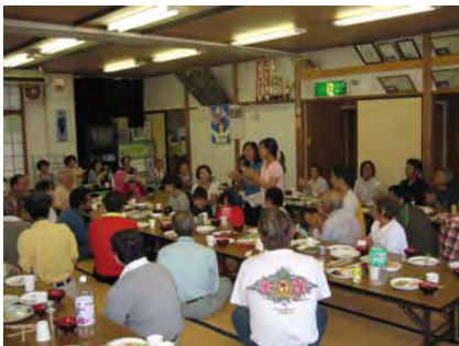
集落の方々との楽しい昼食

A splendid lunch followed which was prepared jointly by the ladies of the village. This interesting day ended with "Songs for Happy Occasions" by the hosts as well as the students of IUJ. Besides being an event which was filled with fun, frolic and feast, it was a real experience with the Japanese villagers and their ways of life. We would like to extend our appreciation to one and all involved in making the event so wonderful and memorable. (Mamta Katwal)