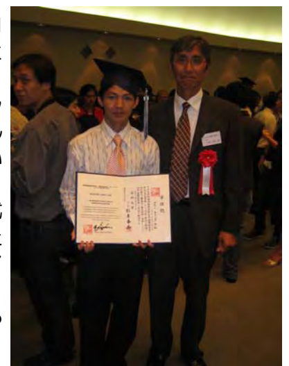
ラムさんとパーティーにて