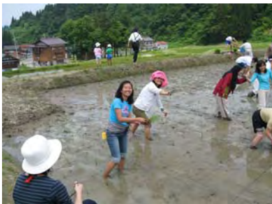
みんな、楽しいそうですね！