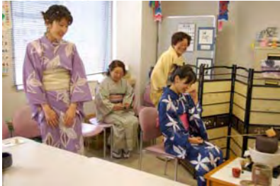
お茶をたてた感想はどうか？