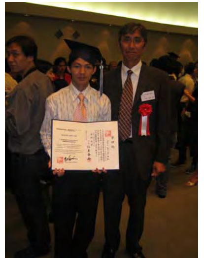
ラムさんとパーティーにて