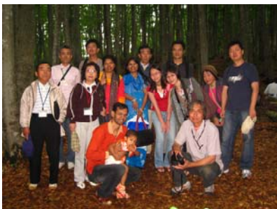
ツアーに参加した会員と学生さん美人林を背景に！ちょっと暗い？