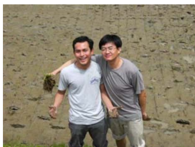
ジェンジャンさん（右）