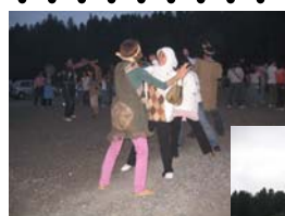
地元の方と 一緒に踊る 学生さん