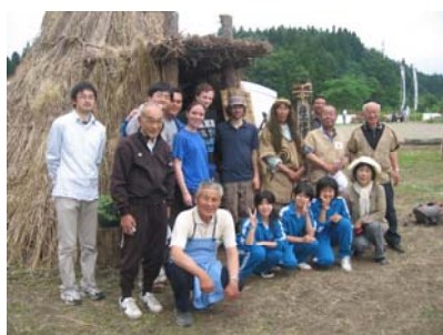
笹山じょうもん市にて 地元の方とハイ、ポーズ！