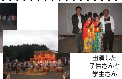
出演した 子供さんと 学生さん