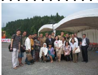
前夜祭に参加した皆さん