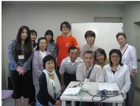
チャンさん(オレンジのTシャツ)と講座に参加された皆さん