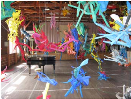
絵本と木の実の美術館

「作品：内なる旅」を背景にできました。私は芸術には疎いのですが、いろいろなおもしろい作品が展示されていて、私も学生さんも楽しみました。ただ、屋内の展示で利用されている建物に、廃校になった学校が利用されていたので、学校がこのようなかたちで利用されていることはとても良いことだと思いつつ、少し考えさせられました。(森山 俊行)