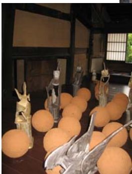
うぶすなの家 (左・上)