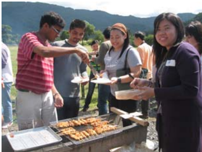
焼き鳥の味はいかがですか？

を来られた日本人の方が参加されたりで、90名近くが集まって、楽しいひと時を過ごしました。今年は特に、大勢の学生さんが準備から後片付けまで手伝ってくれて、何名かの学生さんは、もっと協力したいので何かあったら言って欲しいと向こうから申し出てくれたので、今後の活動がとても楽しみです。