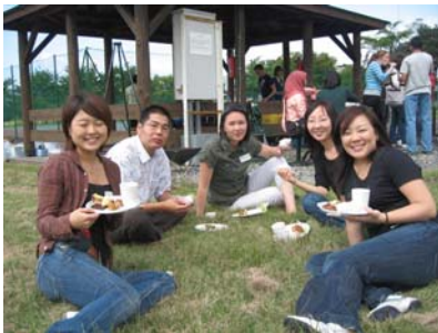
農業体験に来られた方（左右）と新入生（奥：3名）

9月20日（日）に毎年恒例となった新入生歓迎会を国際大学のバーベキューサイトで開催しました。今年もお天気に恵まれて、少し雲が出ていたお陰で、あまり暑くなく、絶好のバーベキュー日和でした。今年も「国際ワークキャンプ」に参加しているボランティアの方も参加され、加えて、近隣で英語を教えている外国の方が来られたり、この土日で東京から農業体験