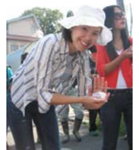
稲刈りの後はみんなでおにぎりを作って食べました