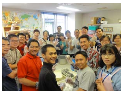
お握り作りは楽しいですか？