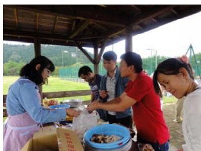
学生さんとバーベキューで使う食材を準備しているところ